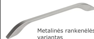
Metalinės rankenėlės variantas