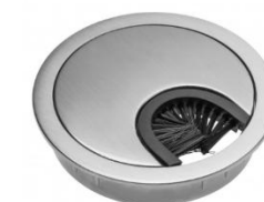
Metalinis dangtelis laidams